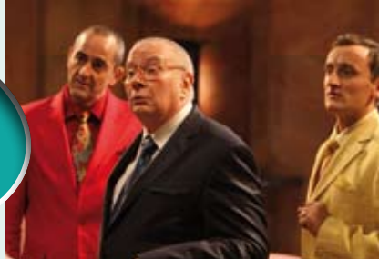
Maaf / Aubert storch Associés Partenaires