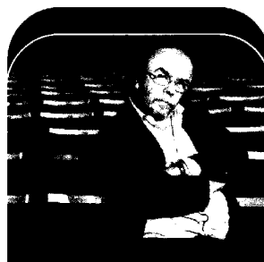
Jean-Michel Ribes, auteur de la série «Palace», a réalisé les spots de la campagne.