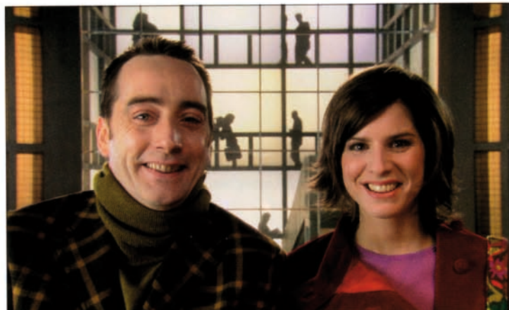
Le film pour LCL-Le Crédit lyonnais fait figure d'ovni... et en a provoqué l'effet!