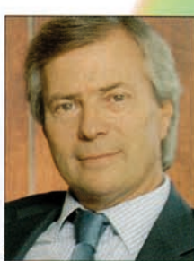
Vincent Bolloré, président non exécutif d'Havas

«Tous les médias nous intéressent» (entretien p.8)